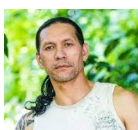
Teheiura Participant Koh Lanta 2021