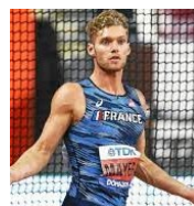
Kevin Mayer Athlète